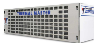
U-образная труба (нижняя установка)