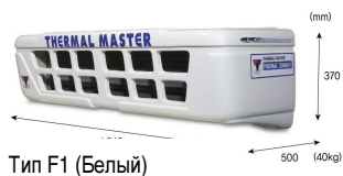
Тип F1 (Белый)